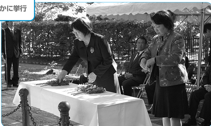
「いしずえの碑」前で献花する遺族の方々

神野顕彰委員会委員長によるあいさつの後、新合葬者の名前を記した銘板の奉納、遺族等による献花が行われるなど、追悼祭はしめやかに挙行された。本年、新たに4柱を加えたことにより、「いしずえの碑」への合葬は696柱となった。