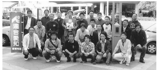
行動を終えたあと、参加者全員で・・・

愛 知県共同募金会・豊橋市支会からの要請に応えてはじまった「赤い羽根募金」ですが、地協の地域貢献活動として、秋の恒例行事となりました。昨年は10月23日の土曜日に設定しましたが、休日にもかかわらず26名の参加を得て、豊橋駅周辺で活動を展開しました。約2時間、立ちっぱなしの活動は少々きつかったのですが、市民の皆さんから、21614円のご協力をいただき、早速共同募金会にお届けいたしました。