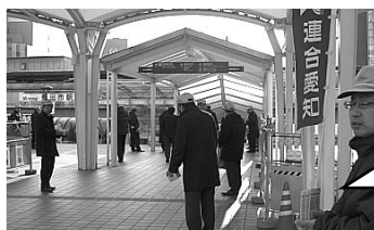
連合愛知一斉街頭宣伝行動(3月11日) 名鉄豊田市駅 ペDESTリアンデッキ

労福協役員の皆さんと一緒に、市長との懇談を実施。それぞれが持ち寄った質問に市長自ら丁寧にお答えいただきました。