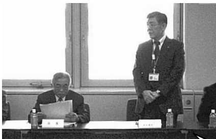
豊田市長との懇談会(12月17日)