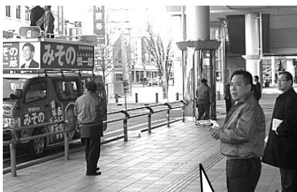
街頭活動(1月21日・他)

労福協役員の皆さんと一緒に、市長との懇談を実施。それぞれが持ち寄った質問に市長自ら丁寧にお答えいただきました。