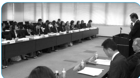
熱心に聞き入る参加者

4月26日、ワークライフプラザれあるにおいて実施した開校式には、養成講座メンバー、神野会長はじめ連合愛知三役、構成組織代表者、男女平等参画推進委員、女性委員など41名が