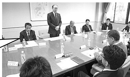
みよし市長との懇談会(2月1日)