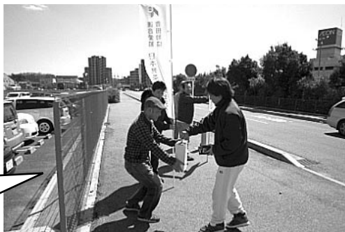
連合東北地方太平洋沖地震救援カンパNO2(3月27日)みよし市ジャスコ周辺 50名参加 99,910円

緊急で実施した救援カンパでしたが、三役、幹事、各議員はもとより各幹事組合の皆さんや家族の参加で実施。豊田市、みよしの皆さんから救援カンパを頂きました。