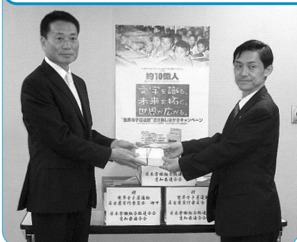
書き損じはがきを贈呈する土肥事務局長