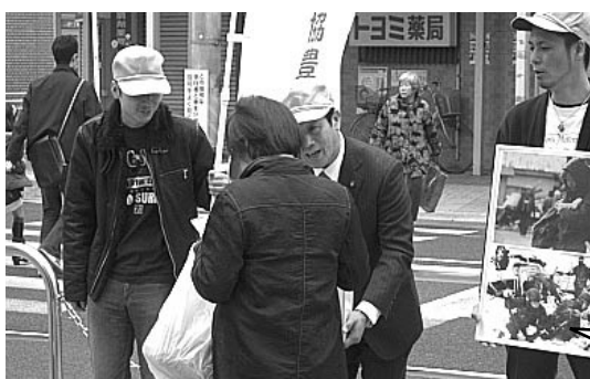
連合東北地方太平洋沖地震救援カンパNO1(3月20日)名鉄豊田市駅周辺 49名参加 123,559円