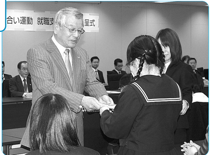
一人ひとりに支援金を手渡す神野会長

神野会長は、生徒一人ひとりに声をかけて握手をして支援金を手渡した後、「今後、皆さんが社会の一員として大いに成長していくことを期待している。今日お渡しした支度金には各構成組織の皆さんの気持ちが込められている」と、就職し社会への第一歩を踏み出す生徒らに激励のあいさつを述べた。生徒代表からは「就職後に自立していくことが厳しい中、貴重な資金をいただきありがとうございます。私は寮に入るので、そこでの生活必需品をそろえたい。これからは社会の一員と