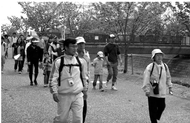
ウォーキングに参加者の皆さん