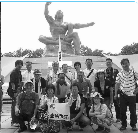
広島(左)・長崎(右)の平和行動に参加したみなさん