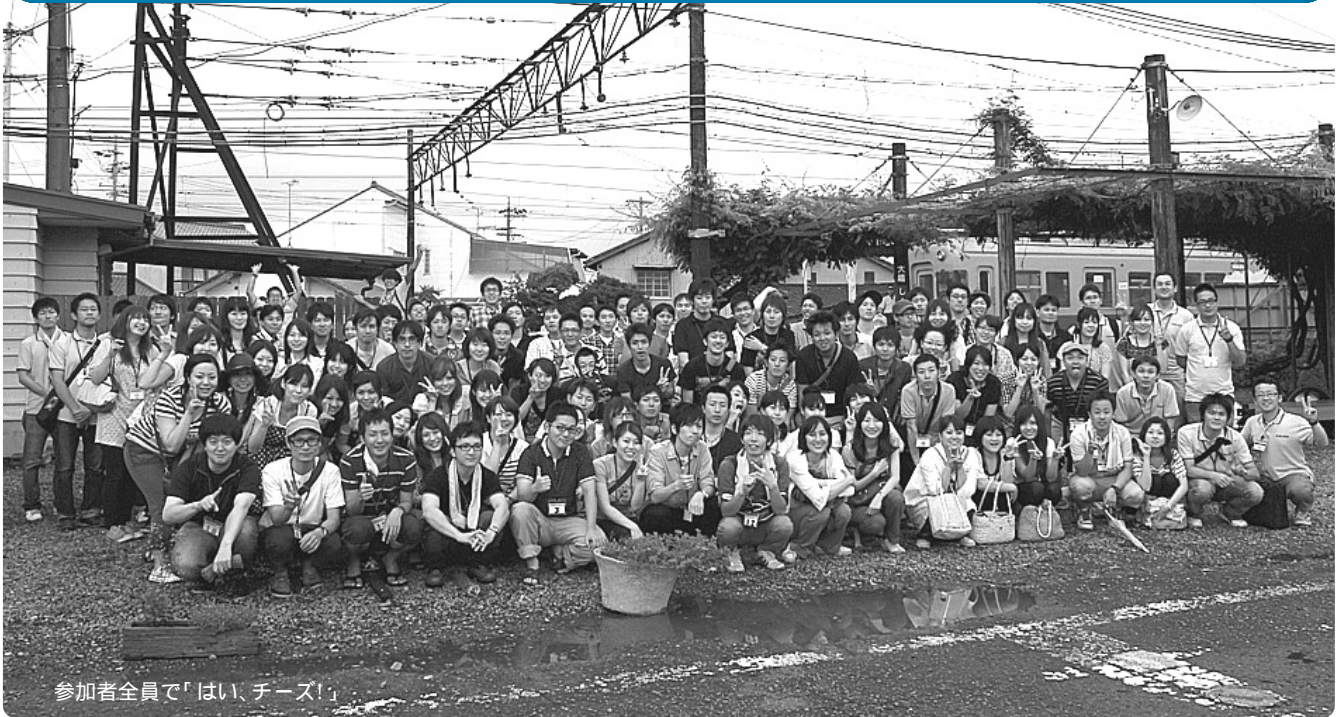
参加者全員で「はい、チーズ!」