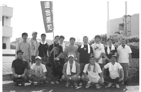
ボランティアに参加者の皆さん お疲れ様でした！

水辺クリーン・アップ大作戦は、半田市の自然環境の保全を目的とした清掃ボランティアであり、誰もが気軽に参加できる“ちょいボラ”で身近に環境を考える活動として参加しています。