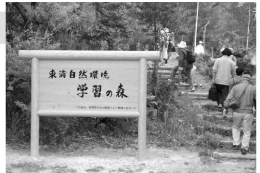
東浦里山「自然環境学習の森」