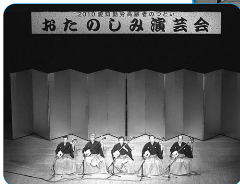
トヨタ豊寿会のメンバーによる津軽三味線