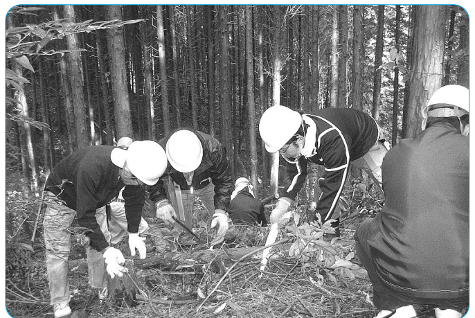
間伐体験をするボランティア

年間3回実施される活動のうち、第1回目となる今回の森づくり活動には、およそ30名が参加した。はじめに愛知県の担当職員から「森林整備の必要性」などについて講義を受けた後、実際に人工林(ひのき)の間伐体験を行った。参加者からは「間伐の必要性を実感した」