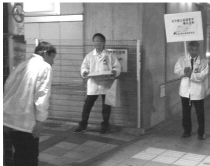
一宮駅にて奮闘中

10月21日夕方から一宮駅にて署名活動を行いました。最初は署名が集まるかという心配もありま