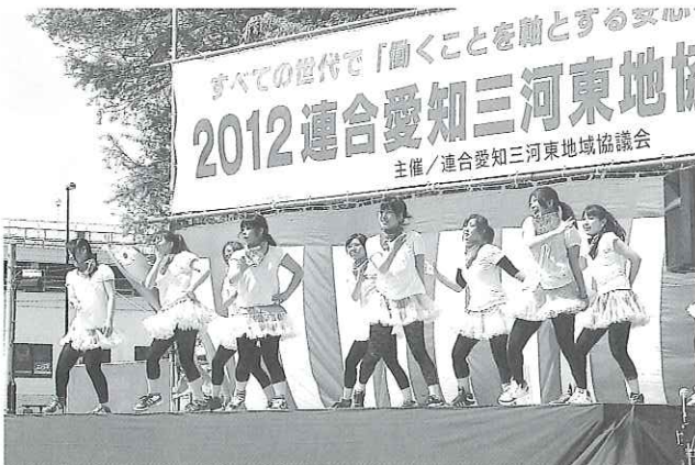
岡崎女子短期大学ダンス部のみなさん

4月29日(日)に豊川市総合体育館前広場において、第83回三河東地協メーデーを開催しました。岡崎女子短期大学ダンス部の皆さんによるオープニングセレモニーを皮切りに式典と交流行事を行いました。交流行事では、餅なげ・お楽しみ抽選会などメーデーに参加をされ