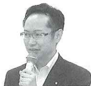
古川元久衆議院議員