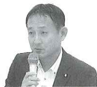
斉藤嘉隆参議院議員

との意見交換会を実施した。国会議員側は、近藤昭一衆議院議員、中根康浩衆議院議員、古川元久衆議院議員、山尾志桜里衆議院議員、大塚耕平参議院議員、斉藤嘉隆参議院議員が参加し、それぞれ近況報告を行った。