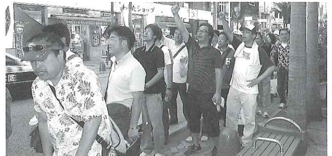
平和への思いをアピール

二日目は、ピースフィールドワークで糸数アブチラガマやひめゆりの塔などの戦跡および米軍基地や基地跡地などを実際に見て学んだ。そして、「米軍基地の整理・縮小と日米地位協定の抜本的見直しを求める集会」に参加した後、那覇市内をデモ行進して、一般市民や観光客の方に平和への思いをアピールした。