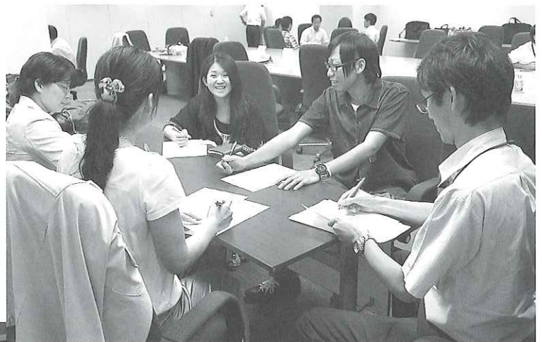
熱心に意見交換をする参加者

連合愛知女性委員会・青年委員会は7月10日、ワークライフプラザれあろにおいて「青年・女性層の労働組合への参画推進について」をテーマに対話集会を行った。4つのグループに分かれ、各構成組織における青年・女性委員会で実施していること、その際苦労していること、今後やってみたいことについて意見交換が行われた。その後、栄に場所を移し、料理教室を実施した。ローストビーフ、ポテトのブルーチーズ焼き&スタッフドトマトをはじめ5品を協力して作った。青年委員からは「自分の構成組織でも行いたい」と