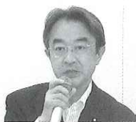
近藤昭一衆議院議員