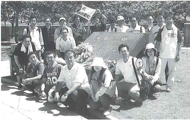
「平和行動 in 沖縄」参加者のみなさん