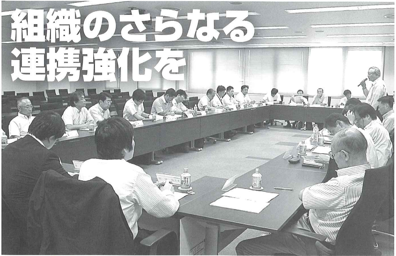
懇談会に参加した構成組織の代表者