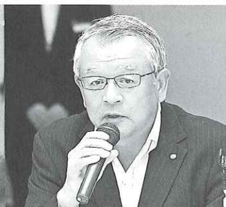
神野連合愛知会長