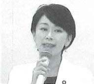
山尾志桜里衆議院議員