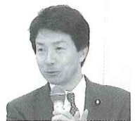
大塚耕平参議院議員