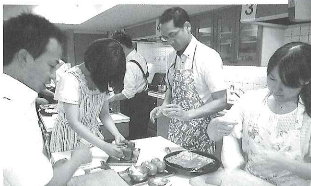
おいしくできますように

いう声や「自分で作るとやはりおいしい」といった声が聞かれ、家事の男女共同参画を体験する充実した会となった。