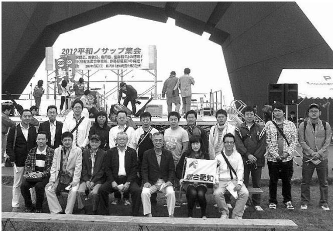
「平和行動 in 根室」に参加した組合員

連合愛知は、9月7日～10日連合主催の平和行動in根室に東副会長はじめ18名で参加した。8日には北方四島学習会が開かれ、全国より約600名が参加し、用意された5つのセミナーから、連合愛知は北方四島の現状や元島民の切実な思いをテーマとしたセミナーを聴講し、北方領土問題に関する見識を深め、運動の重要性を再認識することができたと捉えている。