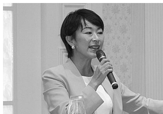
山尾志桜里衆議院議員