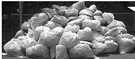
150袋 皆さんの汗とご苦労のカタチです。

豊田市、みよし市のご協力もいただき 約250名で豊田市は約8キロの国道、みよし市は三好池ランニングコース共に除草とゴミ拾いを行いました。