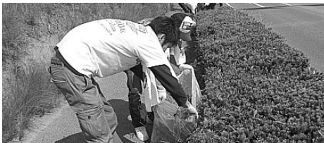
暑い中お疲れ様です。