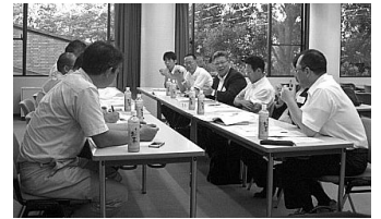
二部グループ別懇談会