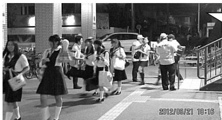
みよし市三好ヶ丘駅

三役、幹事と政策推進議員の皆さんで 通勤、通学の皆さんへ連合愛知グッズ「ストップ・ザ・交通事故あぶらとり紙」を配りながら「ルールを守ってわが身を守れ」など交通安全を呼びかけました。