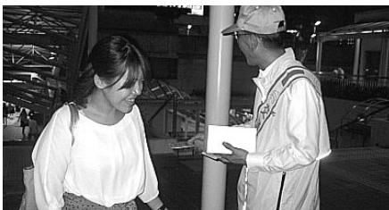
豊田市駅ペDESTリアンデッキ