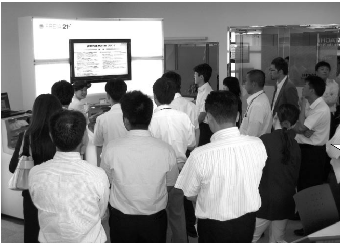
加盟組合「工場視察会」