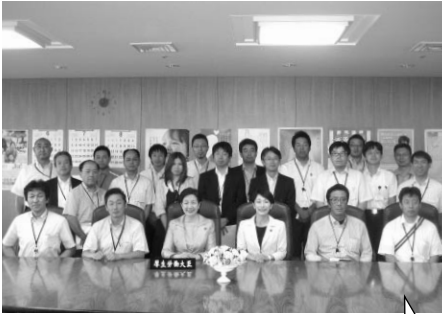
小宮山厚生労働大臣(当時)を表敬訪問