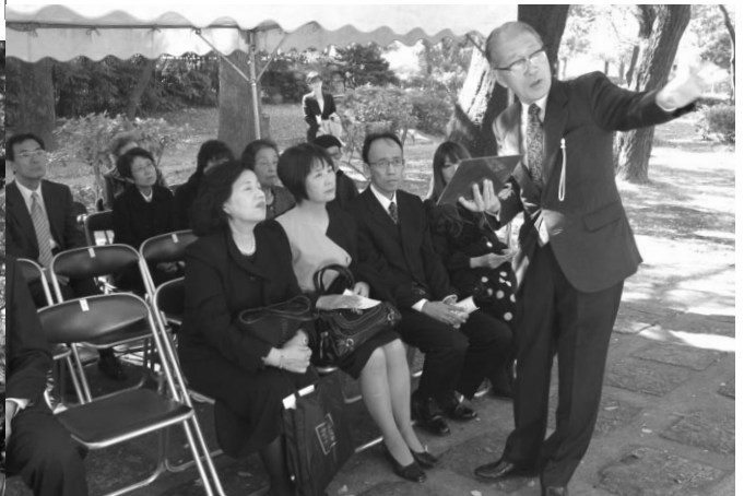
名前が刻まれた銘板の説明を受ける遺族の方々