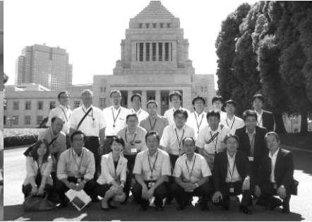
国会議事堂前にて