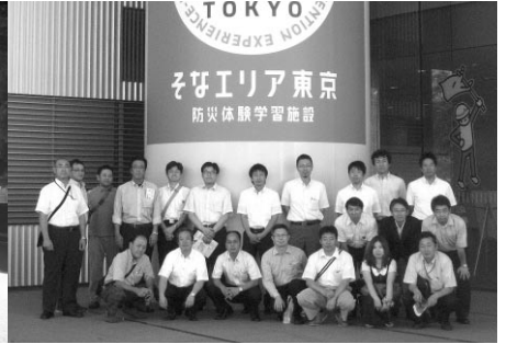
そなエリア東京(防災体験学習施設)を視察

山尾しおり事務所に協力頂き、国会見学(衆議院)と小宮山厚生労働大臣(当時)の表敬訪問を行いました。あわせて、「そなエリア東京(防災体験学習施設)」の視察を行い、防災意識の高揚に努めました。