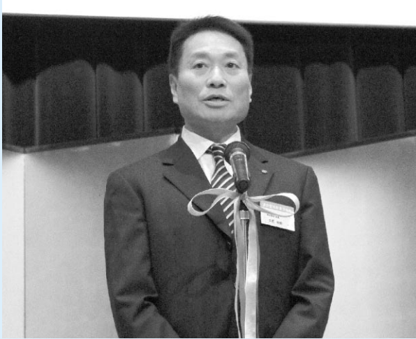
年頭のあいさつをする土肥会長

新年あけましておめでとうございます。連合愛知の諸活動に対し、ご指導ご鞭撻をいただきましたことに心より感謝を申し上げます。