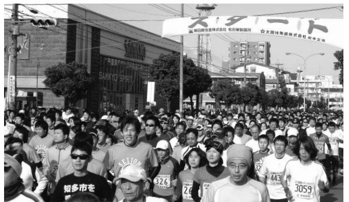
「第28回2012東海シティマラソン」

また、行政等からの要請を受け東海シティマラソン以外にも、常滑市の「アイアンマンレース」・「クリーン作戦」、知多市の「梅まつり」・「産業まつり」、半田市の「水辺クリーンアップ」作戦、東海市社協からの「しあわせ村福祉フェスタ」などにボランティアとして参加しています。