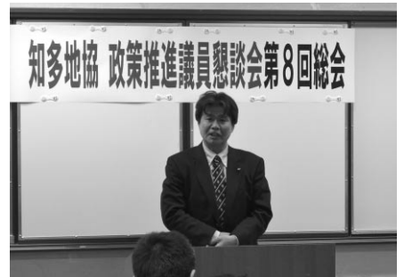
議員懇談会第8回総会