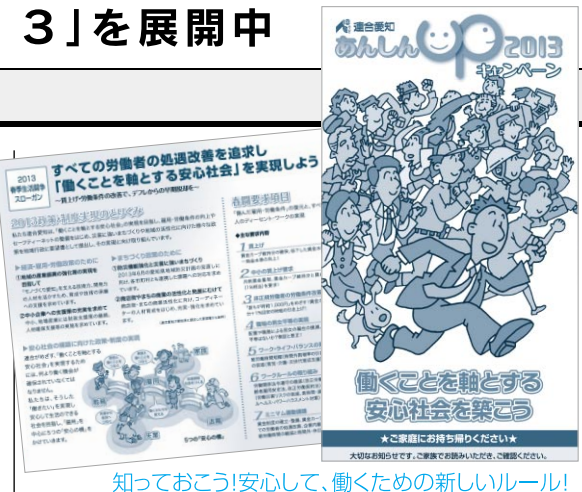
知っておこう安心して、働くための新しいルール!

連合愛知では、「あんしんUPキャンペーン2013」のPR用リーフレットを作成しました。内容は、本年4月から施行される、働くための新しいルール（改正労働契約法等）についてわかりやすく掲載しているのので、ぜひ、職場・家庭にて本リーフレットをご覧ください。連合の政策実現の取組みへのご理解・ご協力をお願いします。