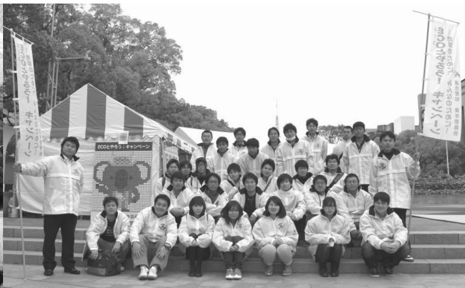
ECOとやろう!キャンペーン