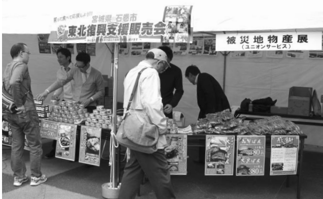
物産販売コーナー

連合愛知はメーデー集会と同日、同会場においてメーデーPRコーナー(勤労者福祉フェア)を設け、連帯活動の紹介を行った。連合愛知や安全衛生センターのコーナーのほか、行政、名古屋NGOセンター、愛知県共同募金会などからの各種ブース27店が出店された。