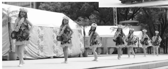
福島県のハーラウ ラウラーナニ