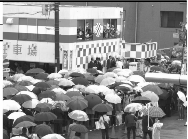
事務所開所式の模様

住所:名古屋市中央区新栄1-35-12 電話:052-238-0039 FAX:052-238-0040