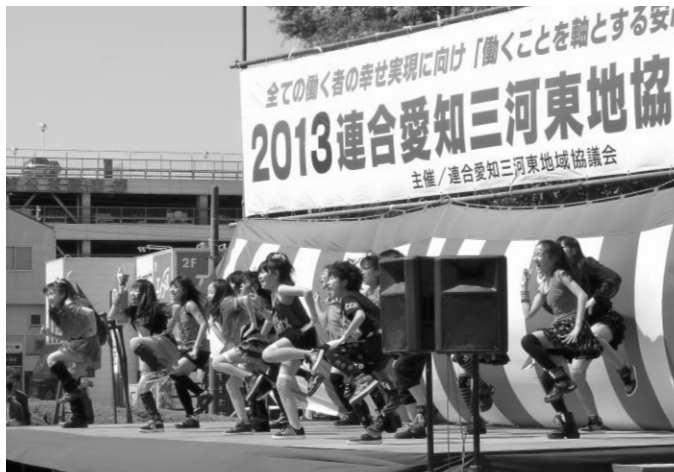
T・C Sproutによるオープニング

4 月28日(日)、豊川市総合体育館前広場において、2013三河東地協メーデーを開催しました。天候にも恵まれ組合員・家族・地域の皆さん、約1,700名と多くの方々に参加をして頂きました。地元で活躍するダンスチーム「T・C Sprout」の皆さんによるオープニングセレモニーを皮切りに、式典と交流行事を行いました。交流行事では、恒例の餅投げやお楽しみ抽選会などが行われ、抽選会では