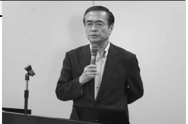
講演をする鹿嶋実践女子大学教授

国の「第3次男女共同参画基本計画」の策定に携わった立場から、社会背景を交えながら、真の男女平等の意味やポジティブ・アクション