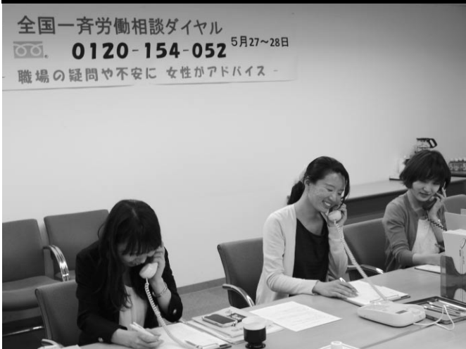
労働相談ダイヤルの様子

今回の全国一斉労働相談ダイヤルは、連合6月の男女平等月間（政府は男女雇用機会均等月間）を控えた5月27日・28日の二日間にわたり実施した。連合愛知は