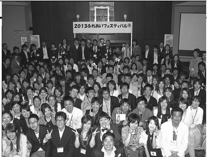
参加者全員でハイ、チーズ!