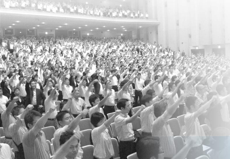
参加者全員で必勝ガンバロー