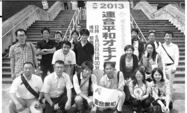
「平和行動in沖縄」参加者のみなさん

二日目は、ピースフィールドワークでひめゆりの塔、平和祈念公園、普天間基地等を実際に