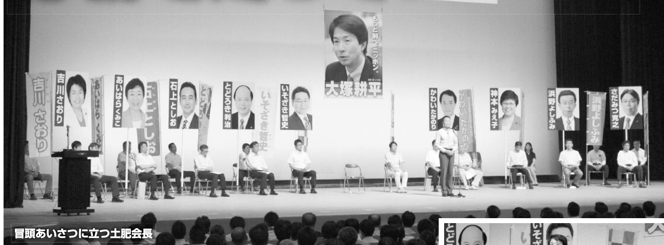
冒頭あいさつに立つ土肥会長