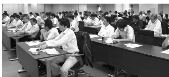
講演を聞く参加者