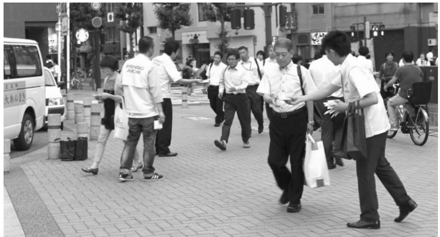
街頭宣伝行動の様子

これは非正規労働者の処遇改善に大きな影響がある最低賃金の遵守と引き上げについて、世論を喚起することを目的として、5月に北海道・沖縄からスタートし6月26日の東京での集結まで、全国300か所でアピール活動を行った。連合愛知は6月14日金山総合駅におい