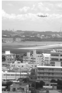
普天間基地のすぐ隣には民家が

見て沖縄の悲劇を改めて知るとともに、沖縄県民は今もなお基地によって生活が脅かされる危険と隣り合わせにある現実を目の当たりにした。そして、「在日米軍基地の整理・縮小と日米地位協定の抜本的見直しを求める集会」に参加した後、那覇市内をデモ行進し、一般市民や観光客の方に平和への思いをアピールした。