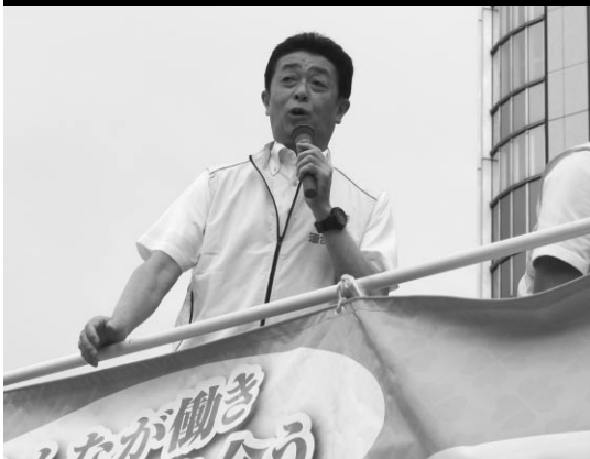
最低賃金の遵守を訴える安永副事務局長