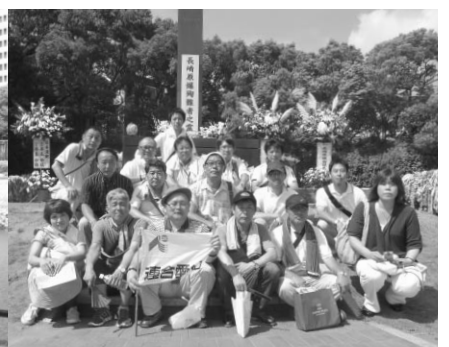
広島(左)・長崎(右)の平和行動に参加したみなさん