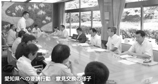
愛知県への要請行動 意見交換の様子