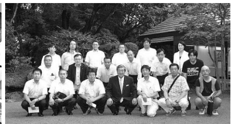
衆議院副議長公邸