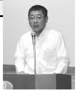
報告をする 連合愛知山本副事務局長

最後に、時期開催県の連合愛知三島事務局長の閉会あいさつで、2日間の討論集会を終了した。