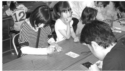
銅板レリーフづくり