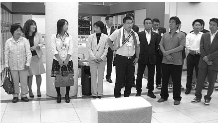
政策推進議員の皆さん