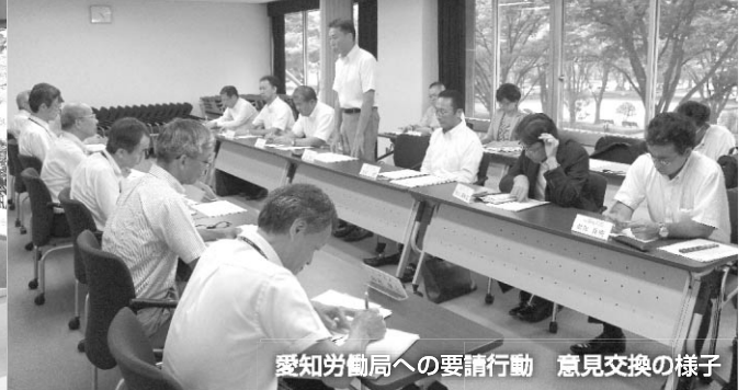
愛知労働局への要請行動 意見交換の様子