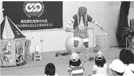
みっきーコメディショー