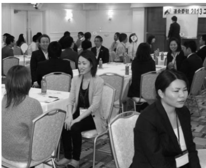
講演後、明らかに空気が変わりました