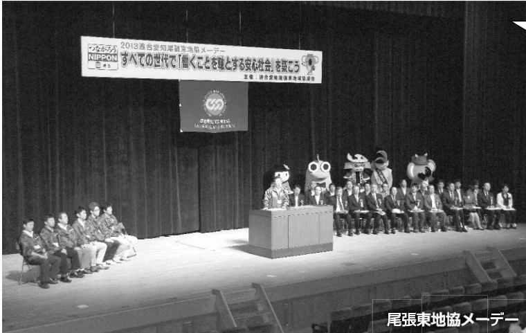
尾張東地協メーデー

尾張東地協メーデーは、加盟組合の組合員・ご家族と、地域にお住まいの一般の方々にも参加して頂き開催しています。今年度は、各市町の首長にあわせ「ゆるキャラ」にもご参加頂き、地協メーデーを盛り上げて頂きました。