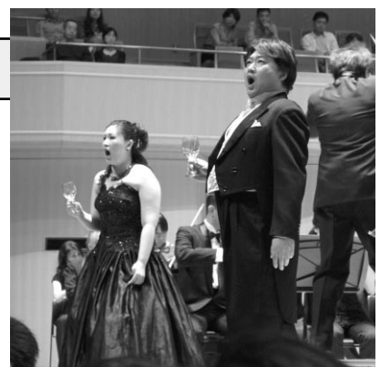
デュエットは庄巻

コンサートは、イタリア最大のオペラ作曲家「ジュゼッペ・ヴェルディ」の生誕200年を記念して「ヴェルディ