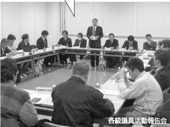
各級議員活動報告会

加盟組合相互の見識の向上と交流を目的として、加盟組合の工場視察会を実施しています。また、工場視察会には、地域に根ざした活動を推進するために連合愛知政策推進議員懇談会メンバーにも参加頂いております。