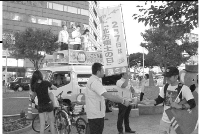
平和への思いをアピール

この街頭宣伝行動には、それぞれの平和4行動派遣団の団長である副会長、事務局である青年委員、女性委員が街頭宣伝カーから実際に目で見、肌で感じた平和への熱い思いを訴えた。