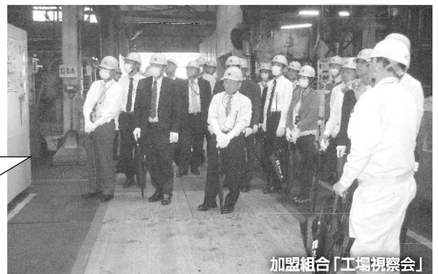
加盟組合「工場視察会」

加盟組合相互の見識の向上と交流を目的として、加盟組合の工場視察会を実施しています。また、工場視察会には、地域に根ざした活動を推進するために連合愛知政策推進議員懇談会メンバーにも参加頂いております。