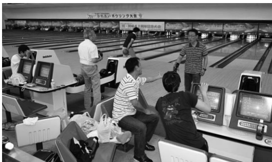
プロ並みの高スコア一続出