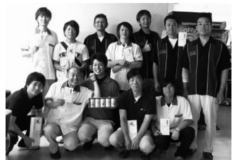
入賞者で記念撮影