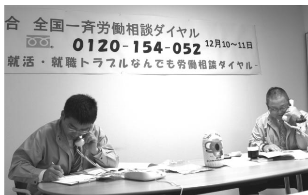
労働相談ダイヤルの様子

連合愛知は今後の「労働相談ダイヤル」などにおいても、すべての働く仲間の不安や悩みに応え、組織化を含め助言や支援など取り組みを続けていく。