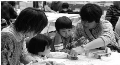
親子でモノづくり