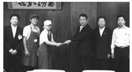
知立市けやき作業所へ