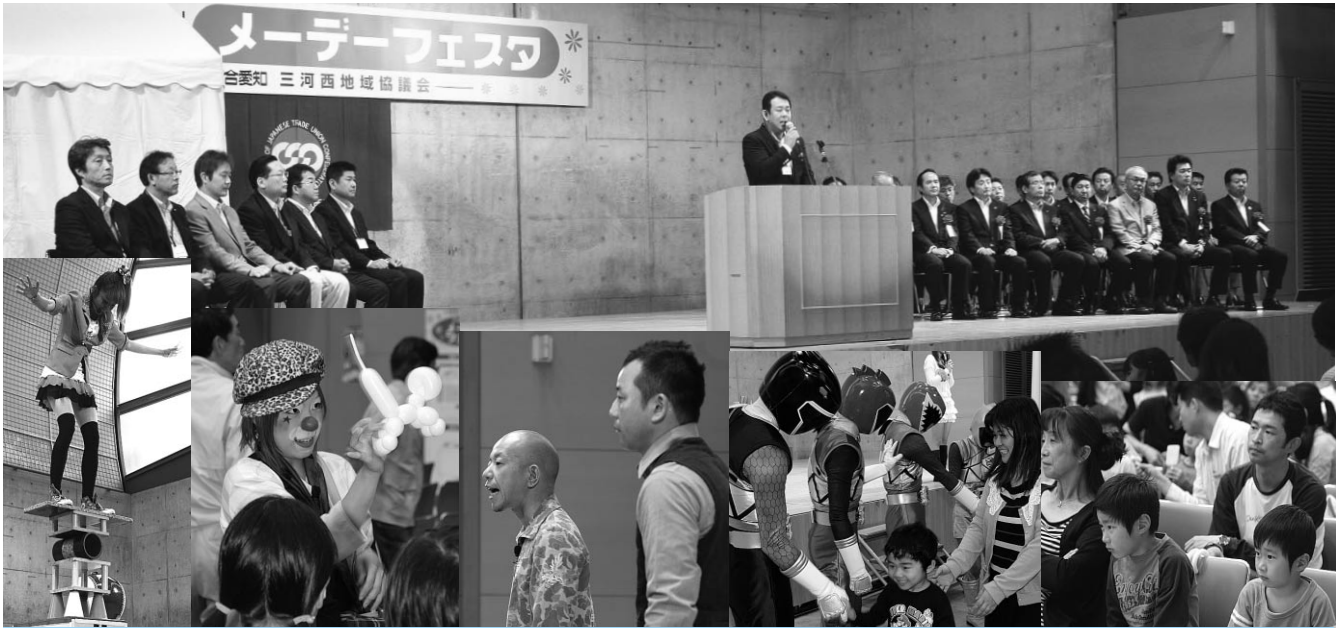
パフォーマンス・お笑い・キャラクターショーと盛りだくさん

会場でチャリティー募金を行い、刈谷、知立、安城、碧南、高浜市の社会福祉へ寄贈しました。