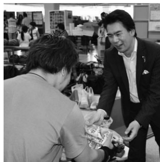
大西代議士も参加者とふれ合い