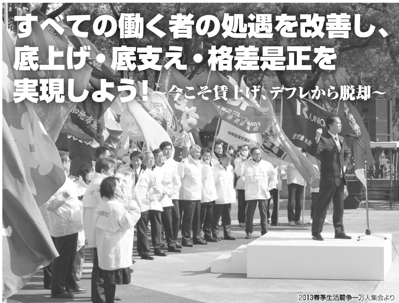
2013春季生活闘争一万人集会より