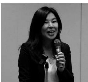
連合本部 南部副事務局長による取り組み説明

本部の南部副事務局長からは「男女平等月間における取り組み課題」として、改正された男女雇用機会均等法施行規則とパートタイム労働法の職場での点検と、第4次男女平等参画推進計画に基づいた取り組みの推進について要請があった。また、日本の法制度と男女平等の歩みを振り返りながら、女性に対する固定観念の見直しと組合への女性参画の必要性について述べられ、認識を新たにした。