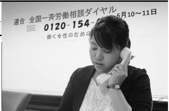
労働相談ダイヤルの様子

今回の労働相談ダイヤルには98件の相談が寄せられ（9割が女性からの相談）、項目としては、退職、配転・出向等とセクハラ・パワハラに関する相談が多く目立った。連合愛知は、今後も「労働相談ダイヤル」などにおいて、すべての働く仲間の不安や悩みに応えるとともに、組織化を含めて助言や支援を続けていく。