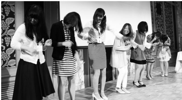
万歩計でふれふれフェスティバル!