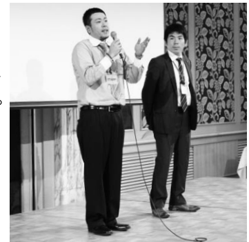
青年委員が盛り上げました!

最後には豪華賞品などが当たるカップルビンゴ大会が行われ、会場は大いに盛り上がり熱気に包まれた。