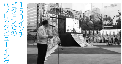
150インチのビジョンでのパブリックビューイング