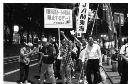
参加者2,000人によるデモ行進