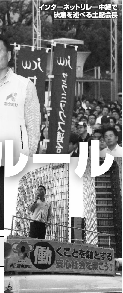
名古屋駅での街頭宣伝行動