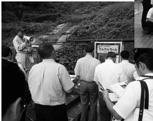
小水力発電施設(愛称:でんでんちゃん)

視察会には、構成組織・政策推進議員等総勢39名が参加し、昨年愛知県が初めて設置した「四