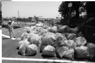
集まったゴミ袋 (約200袋)