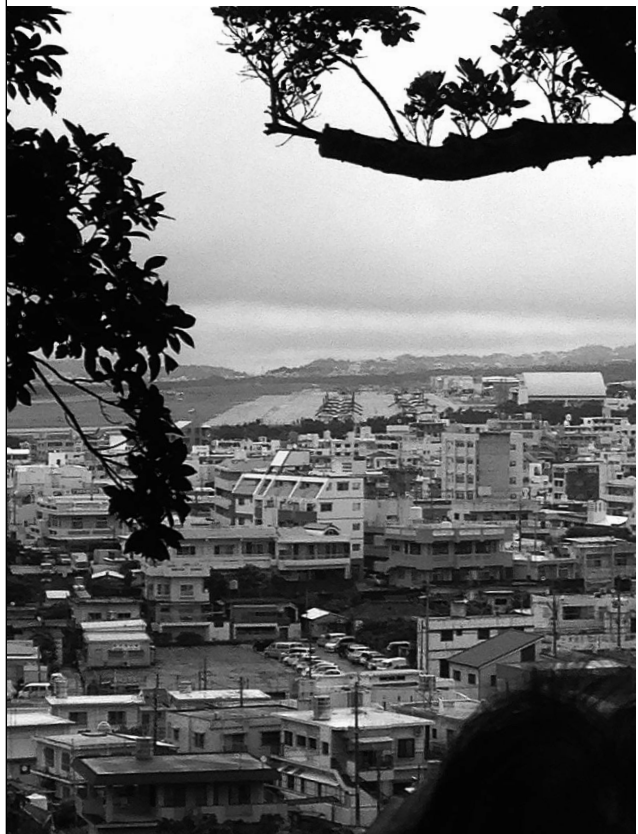
普天間基地のすぐ隣には民家が