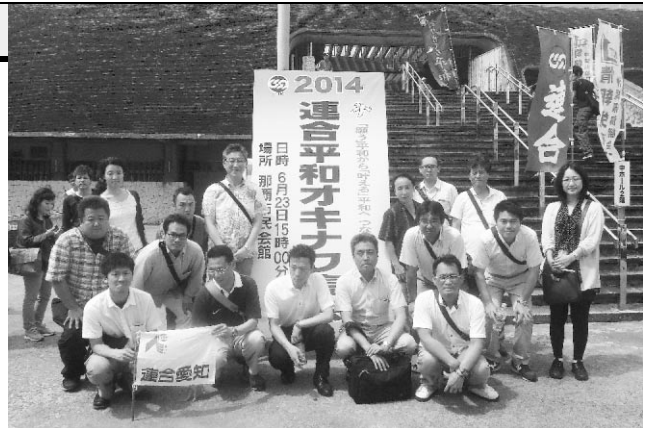
「平和行動in沖縄」参加者のみなさん