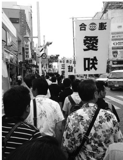
平和への思いをアピール

今回、見聞きし感じたことを持ち帰り、運動の輪を広げていくことを参加者全員で確認し行動を無事終了した。