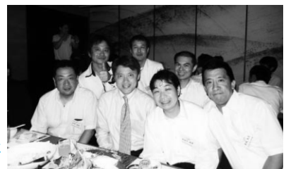
懇親会にも参加された 古本衆議院議員