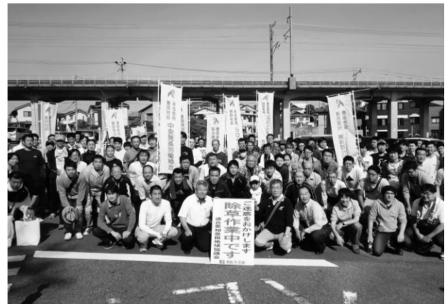
豊田市で実施した皆さん