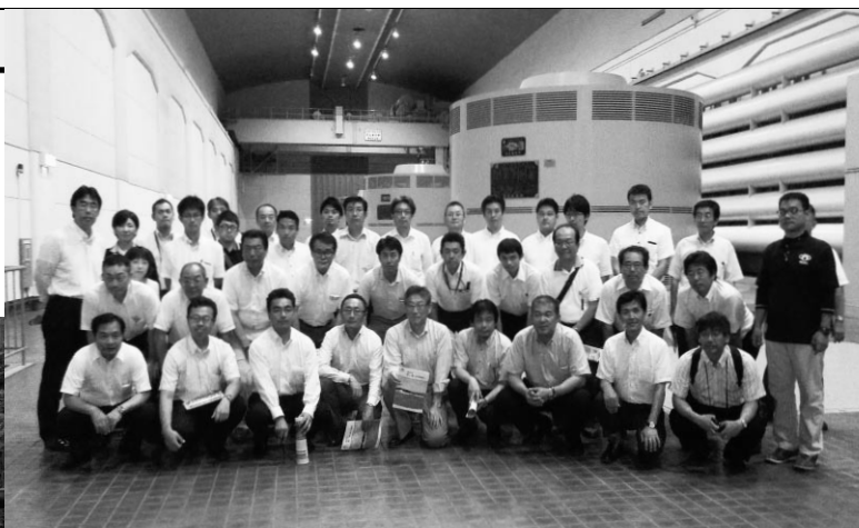
構成組織・政策推進議員のみなさん

谷地区小水力発電施設(新城市)、中部電力の揚水式発電施設「奥矢作第一発電所」「奥矢作第二発電所」と「真弓発電所」(豊田市)を見学した。