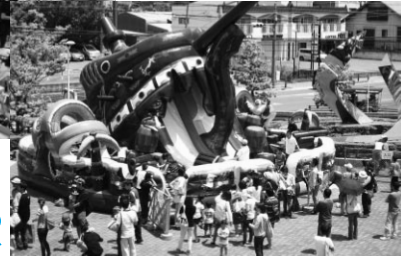
子供達に大人気の ふわふわ滑り台