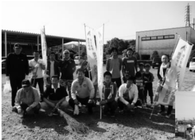
みよし市で 実施した皆さん

年 2回の恒例行事化してきたゴミゼロ除草作業で すが、大勢の方々の協力によって大きな成果に 繋がっています。