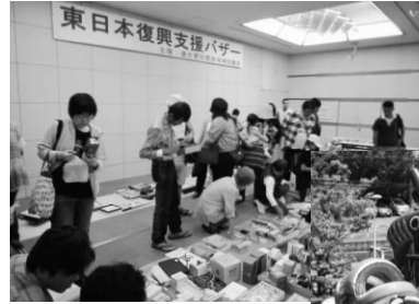
東日本復興支援バザー