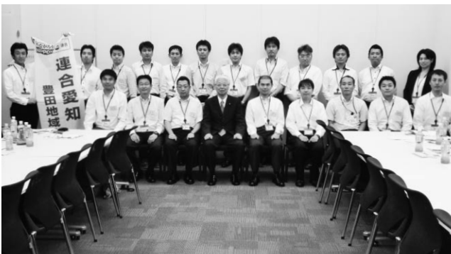
直嶋参議院議員と記念撮影