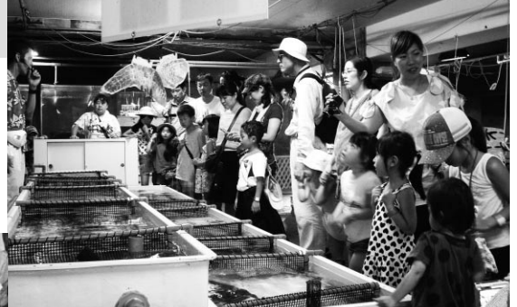
水族館のバックヤード見学

7月26日(土)・27日(日)、家族参加型の行事を南知多ビーチランドにおいて開催しました。当日は天候にも恵まれて、16組合、264名の方が参加。海の