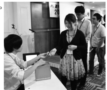
模擬投票をして投票済証を受け取る