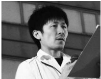
加賀青年委員（沖縄）