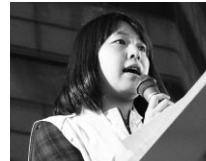
新野女性委員（長崎）