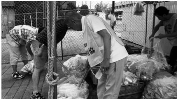
常滑市クリーン作戦

行いました。残念ながら、半田市のボランティア活動におきましては、ゲリラ豪雨のため中止となりましたが、今後も自然環境保護などのために継続して活動していく予定です。