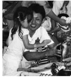
ウミガメと触れ合う

生き物を通して「楽しく」「体験・体感」「発見・気付き」を大切に、子どもたちの豊かな感性を伸ばし、楽しく環境を学ぶ「親子エコスクール(水族館バックヤードツアー)」を開催しました。