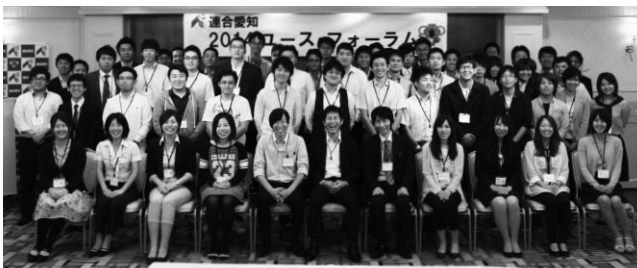
参加者全員で「はい、ポーズ」

講演Ⅰでは『これで職場を活性化!「なんでやねん力」』と題し、吉本興業の芸人から放送作家に転身した2人による、日本初漫才セミナーを受講、「笑いのノウハウ」を活かしながら個の自己開示・組織の相互理解を深め、