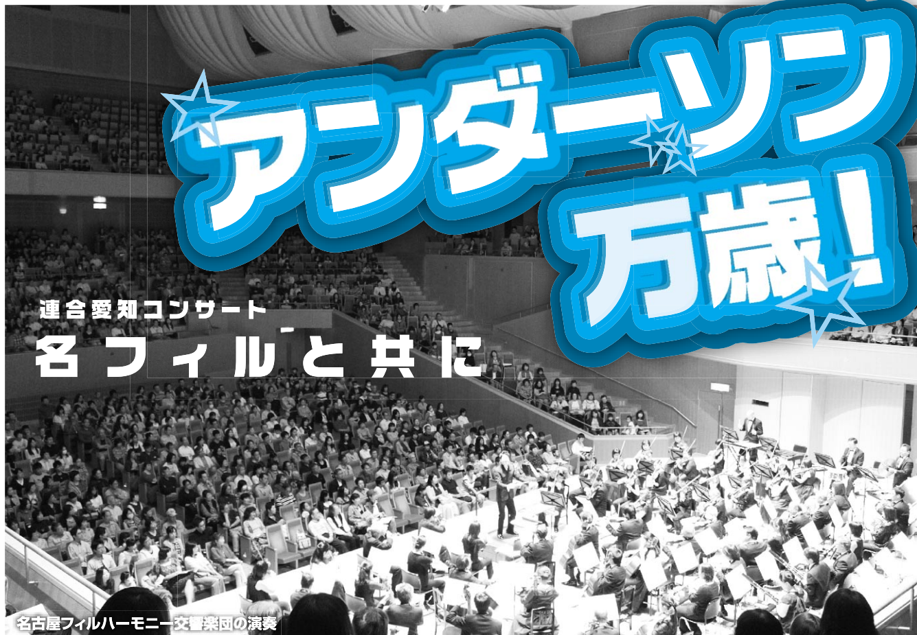
名古屋フィルハーモニー交響楽団の演奏