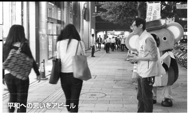
平和への思いをアピール

この街頭宣伝行動には、それぞれの平和4行動派遣団の団長である副会長、事務局である青年委員、女性委員、連合愛知局長が、また今回は、8月に竹島問題の早期解決に向けた諸行動（集会・スタディーツアー）に