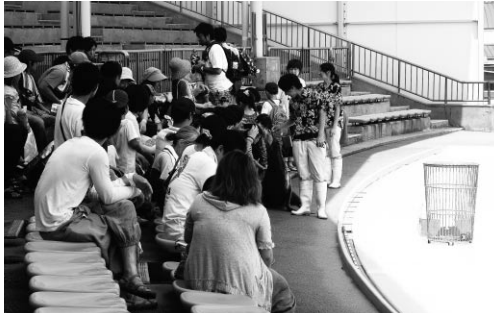
海の生き物を通しての環境学習