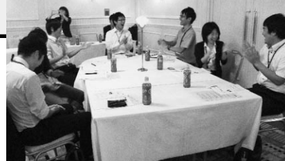
笑いで職場を活性化!

職場活性化に繋げるコミュニケーション術を学んだ。参加者からは「すぐに職場で実行できそう」「できるだけ楽しんで仕事をしていきたいと思った」などの感想が寄せられた。