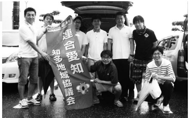
半田市クリーン作戦

半田市、常滑市の2ヶ所でクリーン作戦のボランティア活動に参加しました。毎年、暑さが厳しい時期の開催になりますが、駅の周辺と水辺の清掃活動を