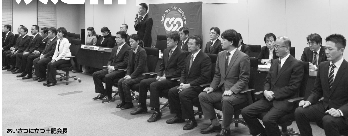
あいさつに立つ土肥会長