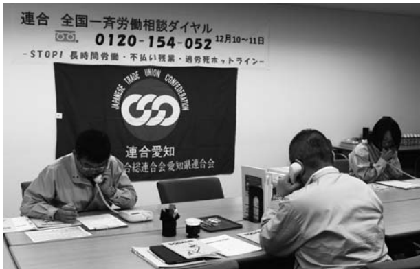
労働相談ダイヤルの様子

12月10日～11日の二日間、連合の全国一斉労働相談ダイヤルの実施に伴い、連合愛知は「STOP! 長時間労働・不払い残業・過労死ホットライン」をテーマとし実施した。