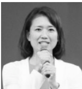
斉藤よしたか参議院議員