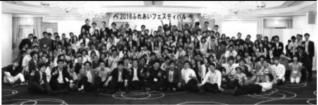
ふれあいフェスティバル参加者

ふれあいフェスティバルは、毎週金曜18:20から放送中の連合愛知ラジオ番組「ENJOY WORKING!!」