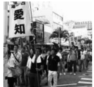
平和への思いをアピール

参加者は沖縄戦の悲惨さと戦争の恐ろしさを改めて実感し、今後運動の輪を広げていくことを全員で確認し行動を無事終了した。