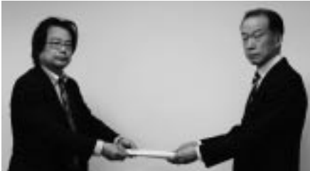
要請書を手渡す清水官公部門長(人事院中部事務局)