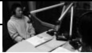
収録中の野々村青年委員 (私鉄総連)