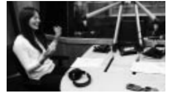
収録中の太田女性委員 (電力総連)

が出演し、放送の様子は各回終了後に、連合愛知ホームページへ写真・音声ともに掲載する。