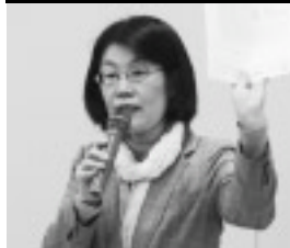
連合中央報告をする