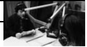
収録中の山田青年委員 (フード連合)