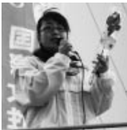
川端男女平等参画推進委員会副委員長

毎年、春季生活闘争における男女平等課題の取り組みの中で、女性委員会を中心に男女平等参画推進委員会と連携して、3.8国際女性デーの意義と女性の地位向上、職場や社会における男女平等の必要性などについて訴えており、当日は女性議員とともに、バラなどを配布した。