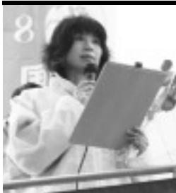
豊嶋女性委員会委員長

連合愛知は3月8日、栄メルサ前において3.8国際女性デーの街頭宣伝行動を行った。