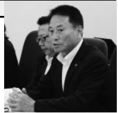
受講生を激励する土肥会長