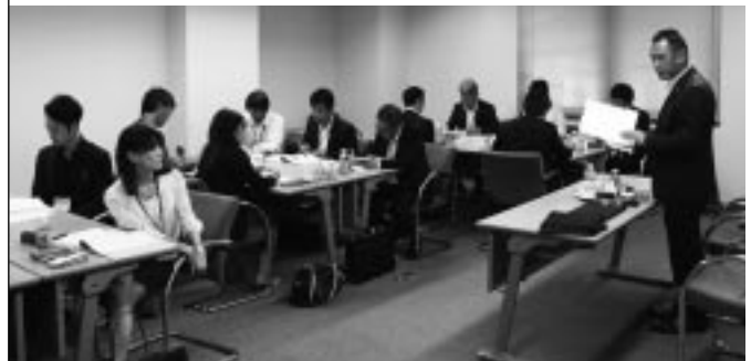
グループワークの様相

なお、このリーダーズコースは受講生を対象とした講座のほかに、オープン講座（無料）も開設しており、希望者は構成組織経由で受講が可能となっている。