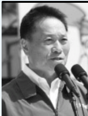
あいさつに立つ土肥会長