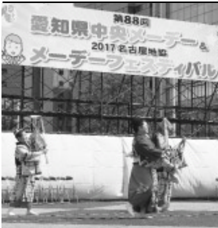
東海熊本県人会による熊本民謡