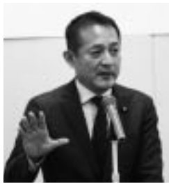
民進党 斎藤嘉隆 参議院議員

講演Ⅰでは、黒田労働法制対策局長より「働き方改革実現会議」における連合スタンスと今後の「働き方改革実行計画」の進め方について説明を受け、「同一労働同一賃金」「長時間労働の是正」の具体的な内容と注視すべきポイントについて講演を受けた。