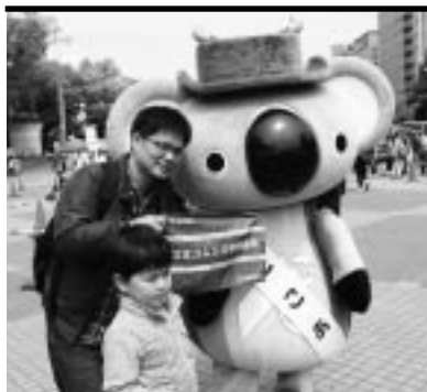
ここあとの撮影会

連合愛知青年委員会は、4月22日(土)久屋大通公園久屋広場にて、第88回愛知県中央メーデーと同日、同一会場で開催された名古屋地協メーデーフェスティバルにて「ECOとやろう！キャンペーン」を実施した。