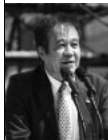
森岡事務局長 (連合熊本 熊本地協)