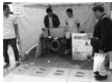
発電床(振動発電)を体験

連合愛知青年委員会の委員11名は、早朝より久屋大通公園周辺の清掃活動を行った後、「節電の重要性を体験(発電床: