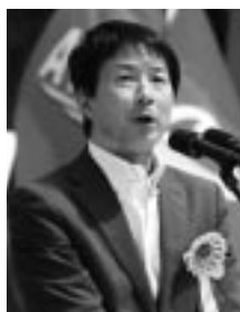
大塚耕平 民進党愛知県連代表