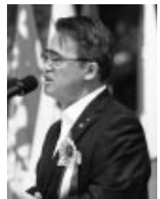
大村秀章 愛知県知事